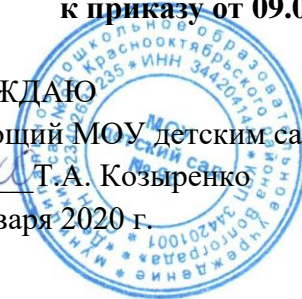
График питьевого режима в муниципальном дошкольном образовательном учреждении «Детский сад № 96 Краснооктябрьского района Волгограда»

Питьевой режим проводится в соответствии с требованиями СанПиНа