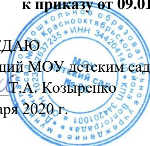
График проведения С-витаминизации в муниципальном дошкольном образовательном учреждении «Детский сад № 96 Краснооктябрьского района Волгограда»